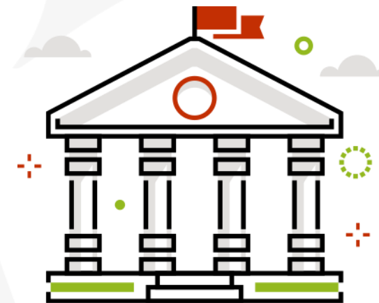
Ład korporacyjny ( Governance )