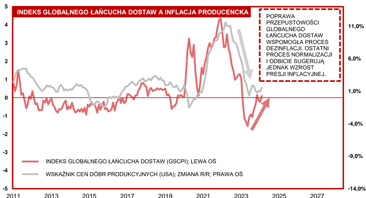
Wykres 1. Wpływ globalnej poprawy po stronie podaży na presję inflacyjną w Stanach Zjednoczonych